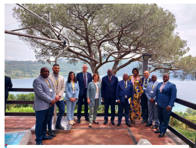
Photo de famille des Officiels avec les Participants

Une réception offerte en l'honneur des invités a marqué le clou de cette cérémonie.